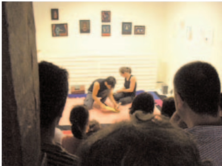
El pingüinazo . Teatro de suelo, figuras y juguetes.