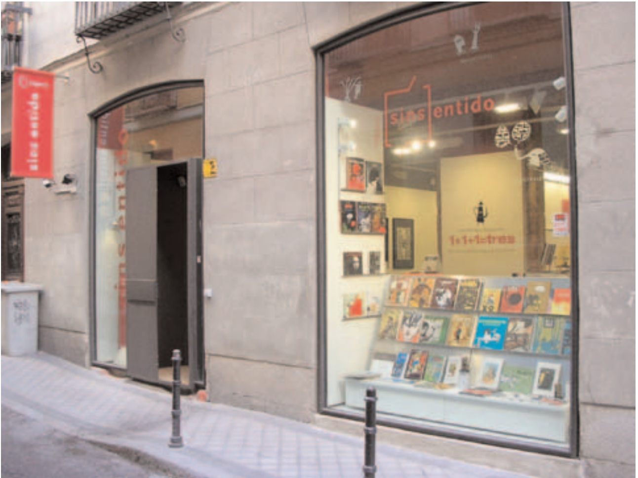
Fachada del Espacio Sins Entido en Válgame Dios, 6