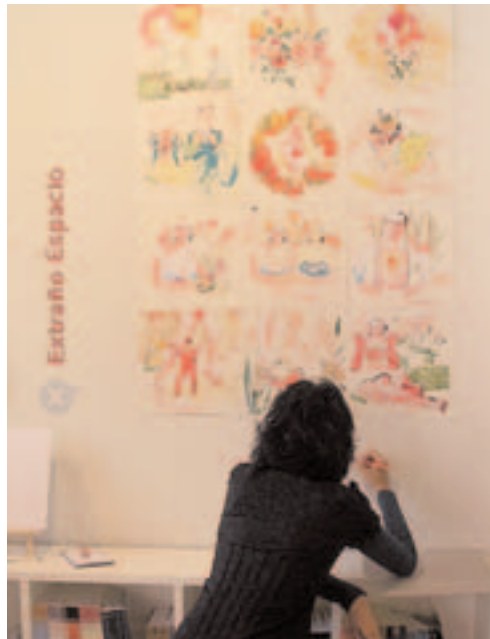
Sonia Pulido en el Extraño Espacio.