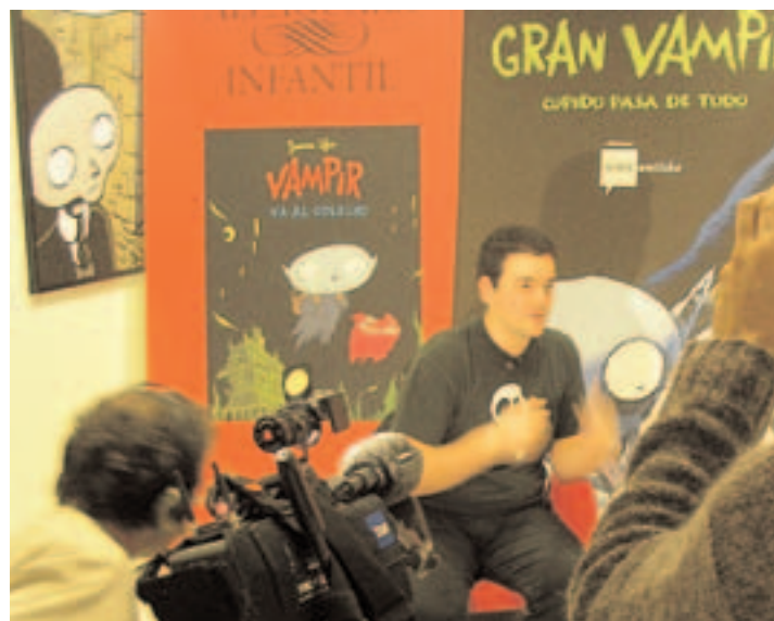
Encuentro inesperado con Joann Sfar, para presentar Vampir y Gran Vampir.