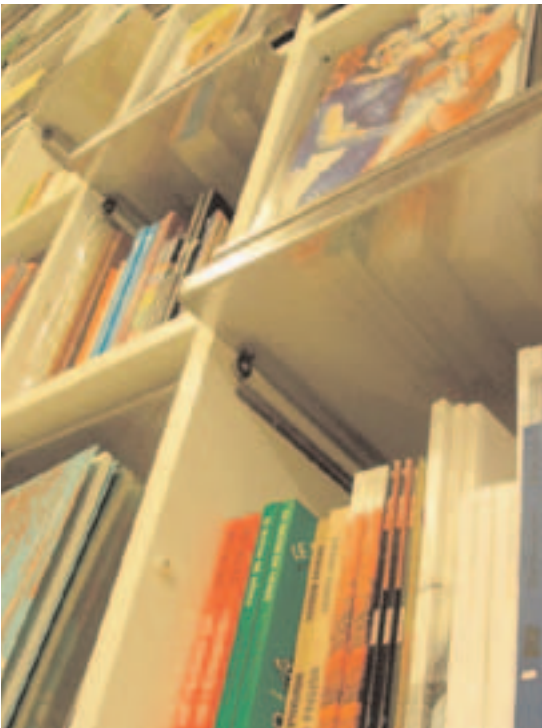
La librería del Espacio