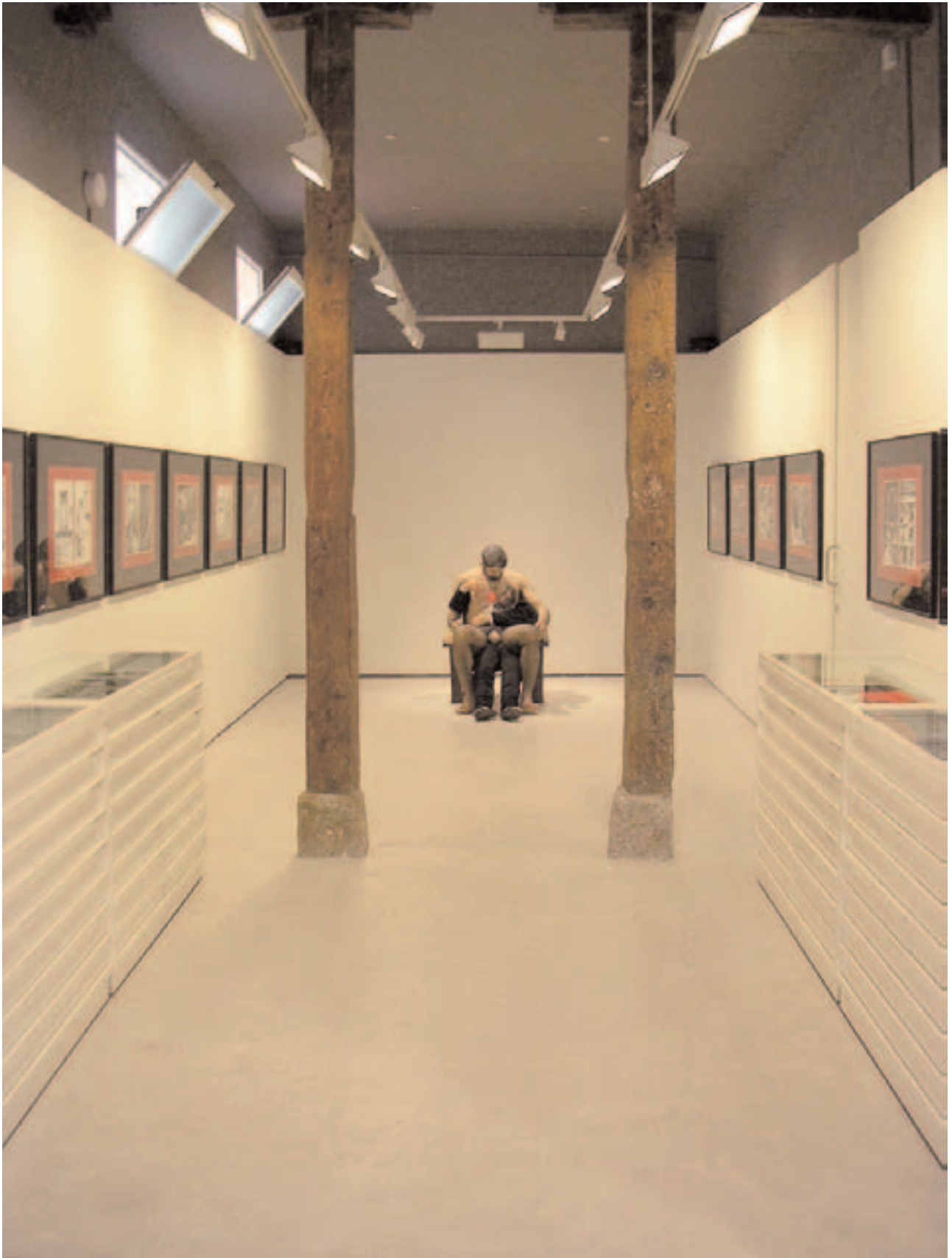
Montaje de la exposición de Rodrigo. Vista de la sala.