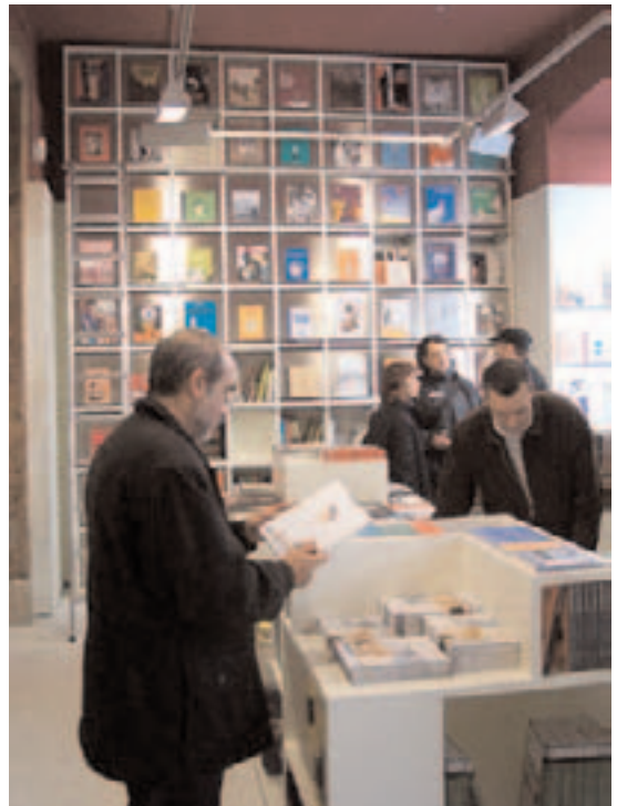
La librería del Espacio